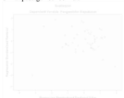
Gambar : Hasil Uji Homoskedastisitas Residual untuk

Uji asumsi homoskedastisitas residual dilakukan melalui pendekatan grafis, yaitu dengan metode scatterplot . Hasil uji asumsi homoskedastisitas residual untuk model regresi linear berganda dapat dilihat pada gambar berikut.