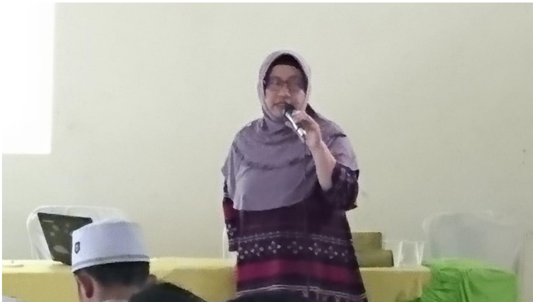
Materi Klasikal oleh Fasilitator