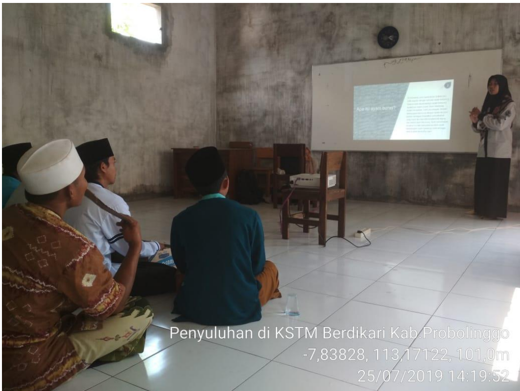
Penyuluhan di KSTM Berdikari Kab.Probolinggo -7,83828, 113,17122, 101,0m 25/07/2019 14:19:52