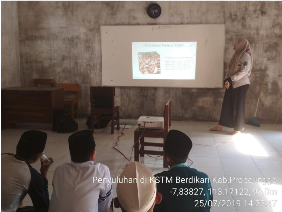
Penyuluhan di KSTM Berdikari Kab.Probolinggo -7,83827, 113,17122, 98,0m 25/07/2019 14:33:47