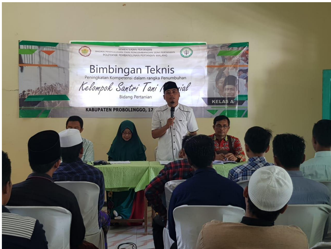
Pembukaan Bimtek Tahap II di Pondok Pesantren Roudlatul Mutta'almiien