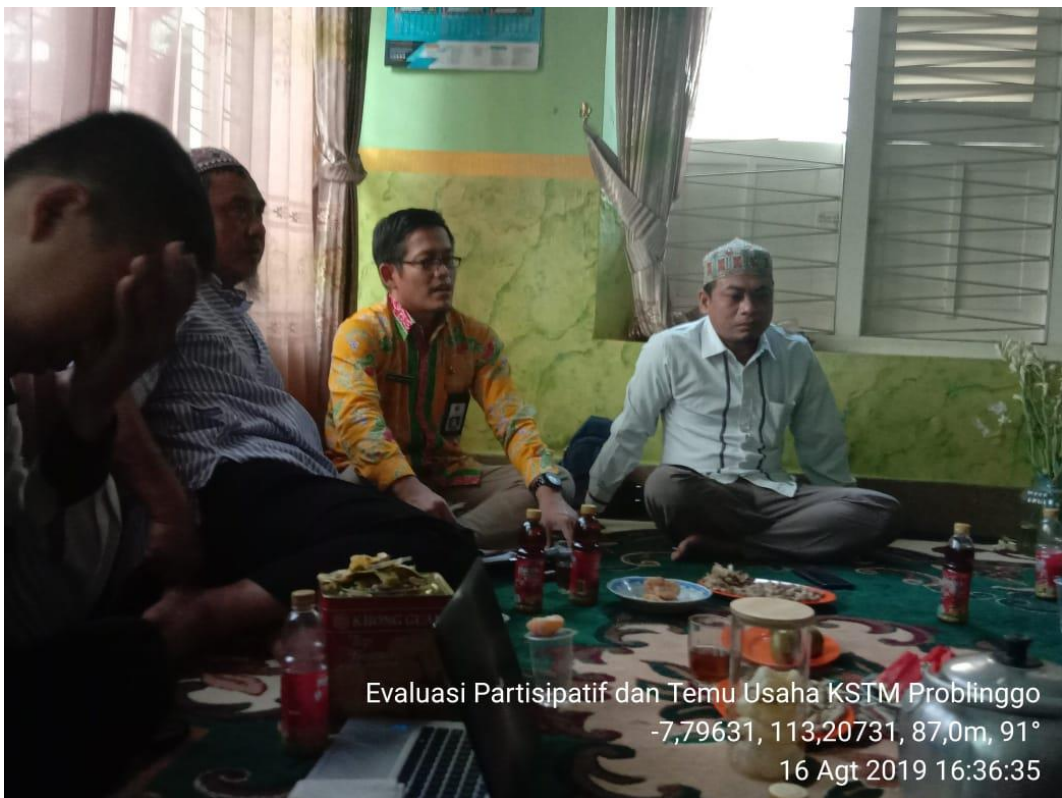
Evaluasi Partisipatif dan Temu Usaha KSTM Problinggo -7,79631, 113,20731, 87,0m, 91° 16 Agt 2019 16:36:35