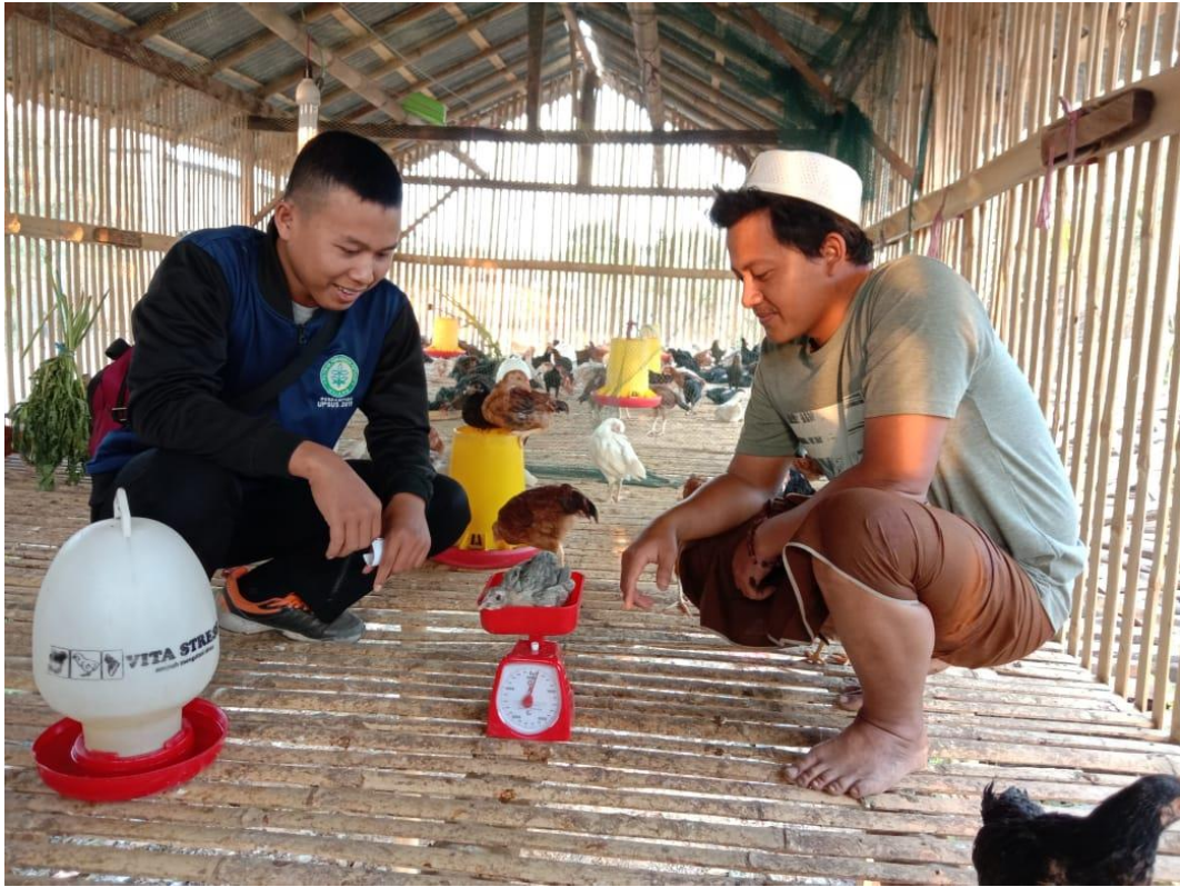
Pendampingan oleh Mahasiswa dalam kegiatan PKL