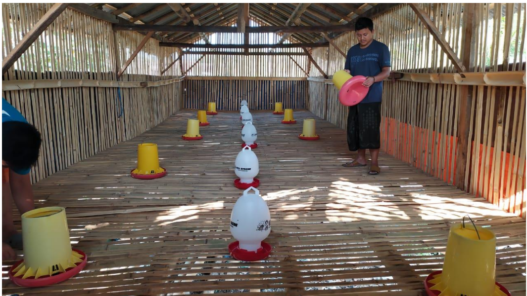
Pendampingan biosecurity dan Persiapan dropping ayam