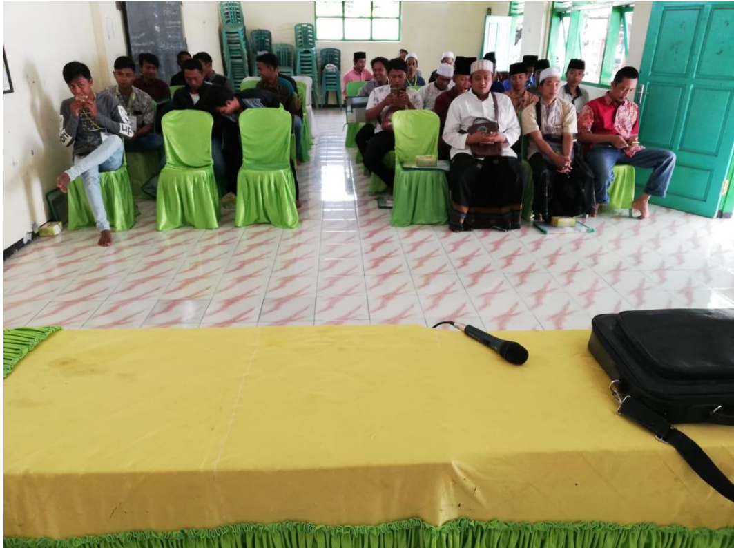
Gambar 2. Pembukaan Bimtek Tahap I