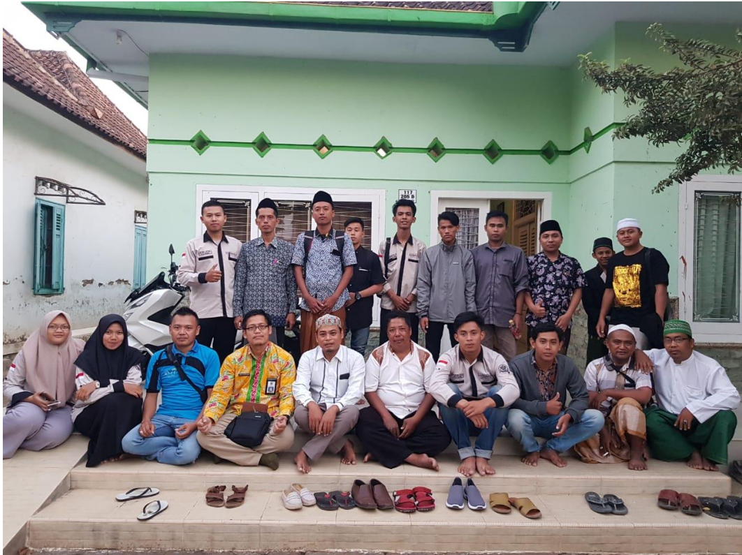
Evaluasi Partipatif yang dilakukan secara mandiri oleh KSTM, pendampingan oleh mahasiswa PKL dan Kabid Produksi Ternak Dinas Peternakan Kabupaten Probolinggo