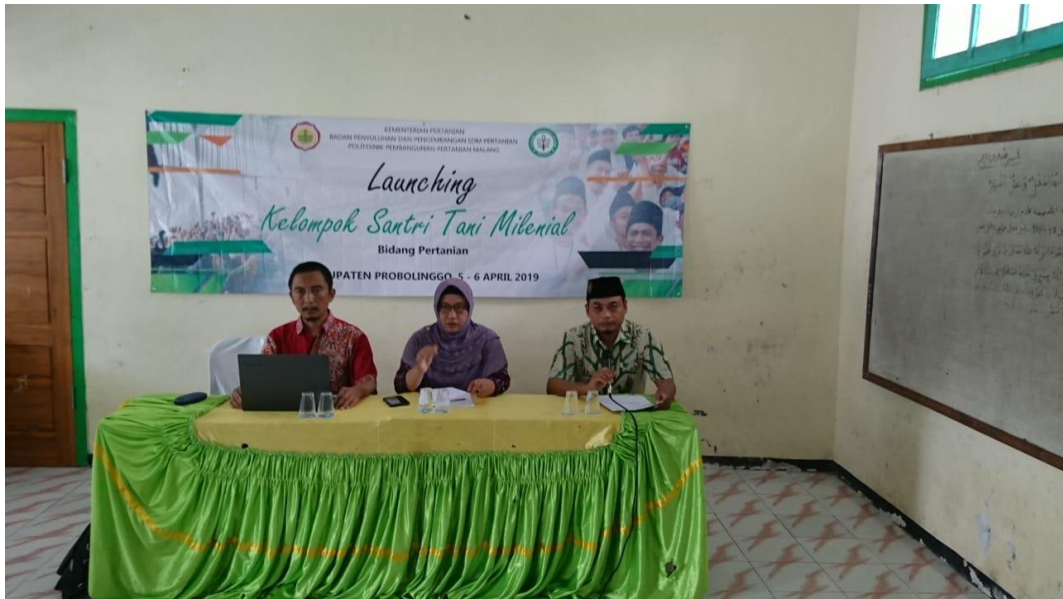
Gambar 1. Pembukaan Bimtek Tahap I