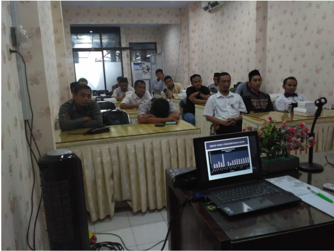
Monev KSTM tanggal 20-21 November 2019 oleh LO