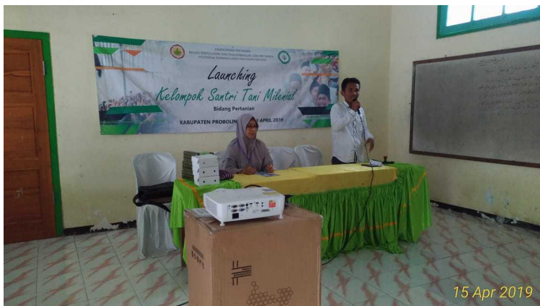
Penutupan Bimtek Tahap I (Launching)