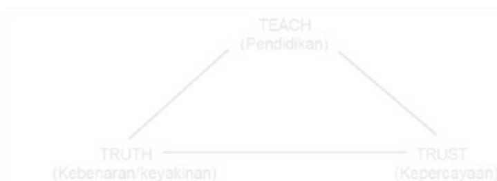
Gambar 1.1 Falsafah Penyuluhan Pertanian

Di Amerika Serikat, dikembangkan falsafah penyuluhan yang dikenal dengan istilah 3T, yaitu sebagai berikut: