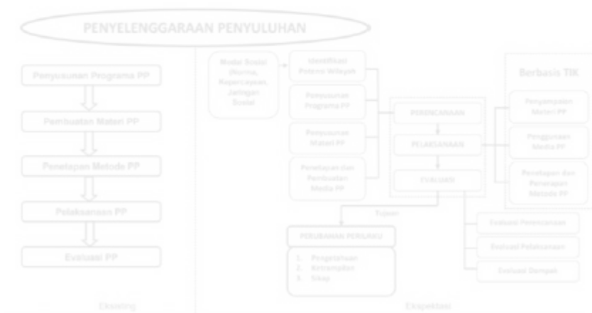
Gambar 5.4. Rekonstruksi Penyelenggaraan Penyuluhan Pertanian