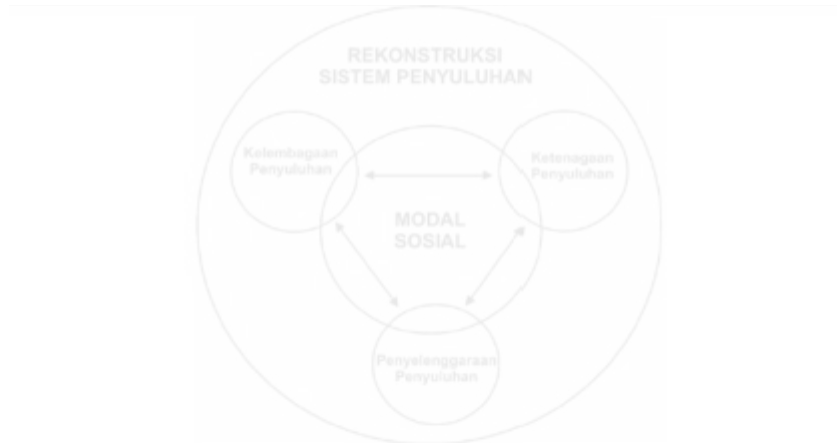
Gambar 5.1. Rekonstruksi Sistem Penyuluhan Pertanian