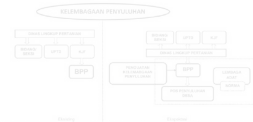
Gambar 5.2. Rekonstruksi Kelembagaan Penyuluhan Pertanian