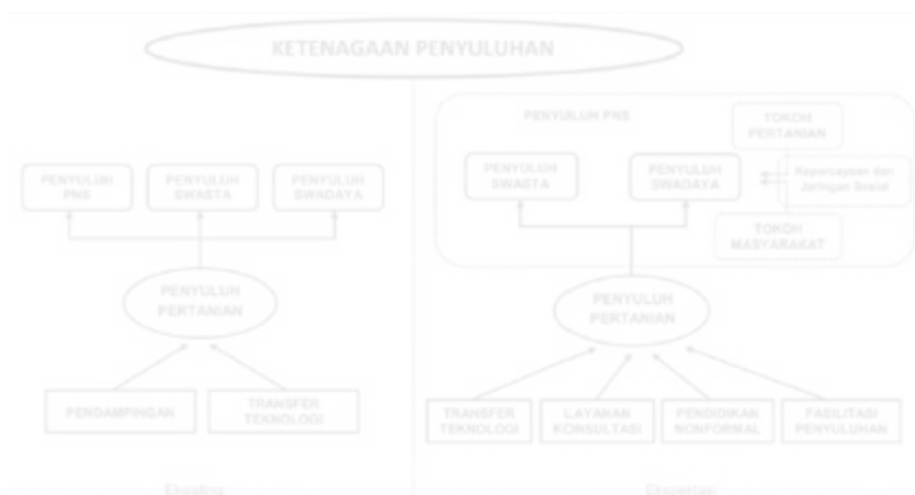
Gambar 5.3. Rekonstruksi Ketenagaan Penyuluhan Pertanian